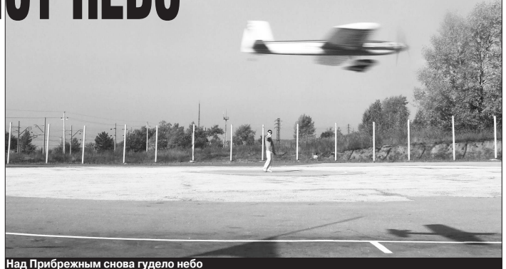
Над Прибрежным снова гудело небо

Шум моторов разносился над Прибрежным, где проходил первенство вузов по авиамоделированию. 60 участников. 15 вузов. 11 городов России. В субботу соревновались кордовые модели в скорости, пилотаже, гонкам и воздушном бою. На следующий день соревнования продолжались на аэродроме в Бобровке.