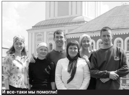
И все-таки мы помогли!