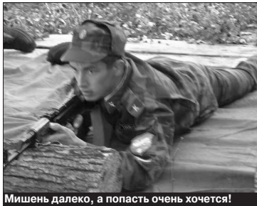
Мишень далеко, а попасть очень хочется!

А вечерами курсанты возвращались в «Полет», успевая поучаствовать в культурно-массовых мероприятиях. «Они военные, но они и