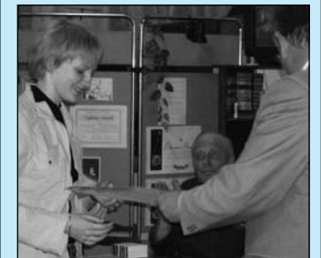
Вручение наград победителям проходило в музее авиации и космонавтики

18-19 мая в СГАУ прошла Поволжская региональная олимпиада по сопротивлению материалов. В Самару приехали команды Саратовского государственного технического университета, Казанского государственного технологического университета имени Туполева, Пензенского государственного университета архитектуры и строительства, Пензенской государственной технологической академии. Гостей поддержали студенты Самарского государственного технического университета, Самарского государственного архитектурно-строительного университета и Самарской государственной академии путей сообщения.