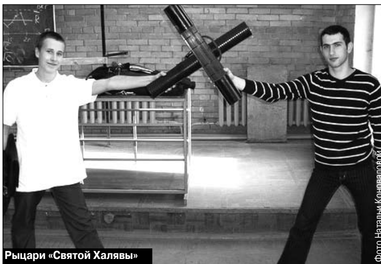
Рыцари «Святой Халявы»

У студентов множество примет и ритуалов. Подавляющее большинство из них связано с экзаменами и не удивительно, ведь сессия является кульминацией целого полугодия. Напряженные драматические переживания надвигаются неумолимо, как и сама сессия. Независимо от того, круглый ты отличник или вечный троечник, сдаешь свою первую сессию или десятую, каждый экзамен - это всегда событие. Перед экзаменом чувствуешь волнение, мысленно оцениваешь степень своего знания и незнания, думаешь о том, какой билет достанется. Сколько ни учи, всегда что-то