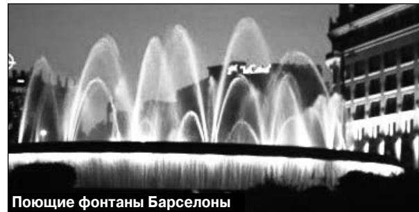
Поющие фонтаны Барселоны

Из всех экскурсий, предлагаемых путеводителем, мы решили выделить наиболее интересные и необычные. Не будем останавливаться на описании корриды, все слышали оперу Бизе «Кармен», многие читали «Фиесту» Хемингуэя. А слышали ли вы о поющих фонтанах вечерней Барселоны? Следуя в такт мелодии и света, струи воды причудливо изгибаются и танцуют над площадью.