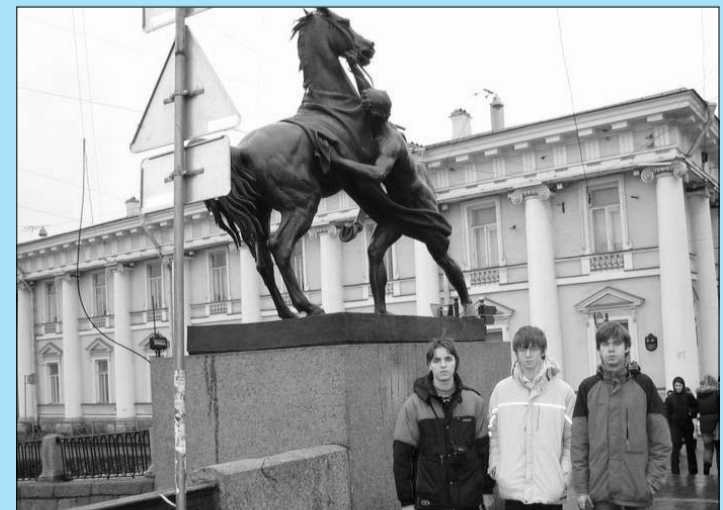
Команда лицейстов на Аничковом мосту, на заднем плане - Аничков дворец