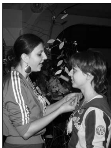
Последняя ночь... самые искренние добрые слова, которые накопили за эти безумные 4 дня... ночь, которая сблизила всех

Полосы подготовили ребята Центра молодежных инициатив «Re@ctiv»