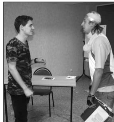
Пираты, попугаи, задания, кусочек карты - все это квест

Цени общение с людьми! Связь бережно поддерживая между, В твоих руках оно, храни! Вернись в себя, когда ты был В НАДЕЖДЕ... Эльвира Абзалова