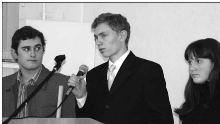
Студенты: нам есть что сказать, и мы готовы к серьезному разговору

Будет ли спонсироваться экспедиция турклуба на Эльбрус? Г. Р.: Университет не спонси-