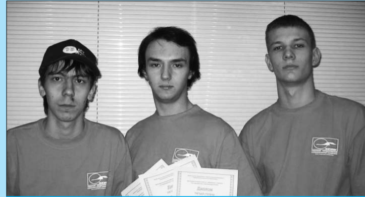
Команда университета после награждения

Сборная команда университета единственная из вузов Самары и Самарской области участвовала в полуфинальных соревнованиях чемпионата мира по программированию среди сборных команд вузов (North-Eastern European Regional Contest) в Санкт-Петербурге.