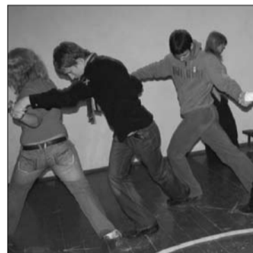
По кочкам к заветной цели - сделать это можно только всей командой!