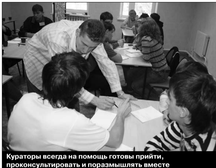
Кураторы всегда на помощь готовы прийти, проконсультировать и поразмышлять вместе