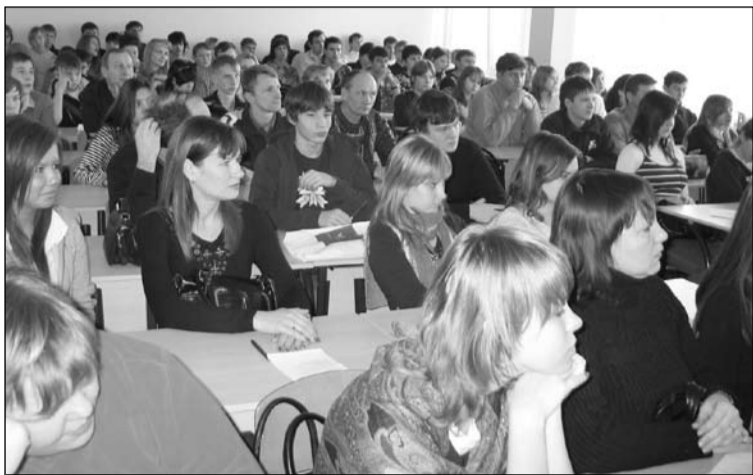
Тольяттинские школьники узнали для себя очень много интересного