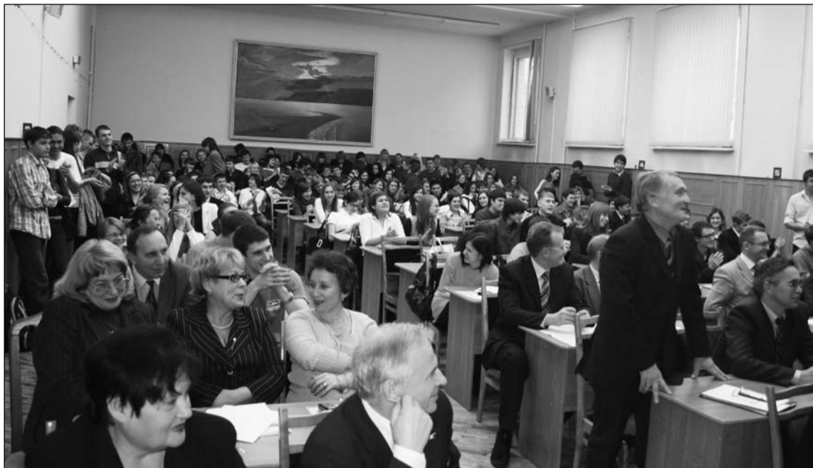
Встреча с ректором пользовалась ошеломляющим успехом

со стр. 1 Студенты-второкурсники выявили четыре проблемы и предложили свои варианты их решения. Студентов волнуют вопросы безопасности в университете и на прилегающей территории, низкая эффективность каналов передачи информации от администрации к студентам и каналов обратной связи, создание системы целенаправленного позиционирования университета в стенах alma mater и вне его и создание сети мест отдыха на территории корпусов.