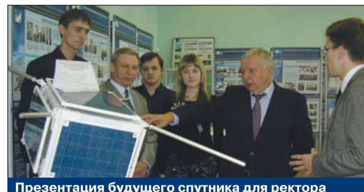
Презентация будущего спутника для ректора

«Хорошо, что руководство ЦСКБ-«Прогресс» предоставило нам возможность выводить в космос научные грузы, в том числе те, которые создаются руками молодежи. Так, в рамках софинансирования национального проекта мы можем вывести на орбиту до 50 килограмм массы (столько будет весить готовый космический аппарат). Вывод же одного килограмма стоит 20 тысяч евро. Хотя надо помнить, что каждый килограмм массы – это огромные интеллектуальные усилия, много электроники, различной конструкторской работы».