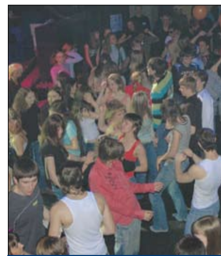
Зажигательное открытие нового учебного сезона