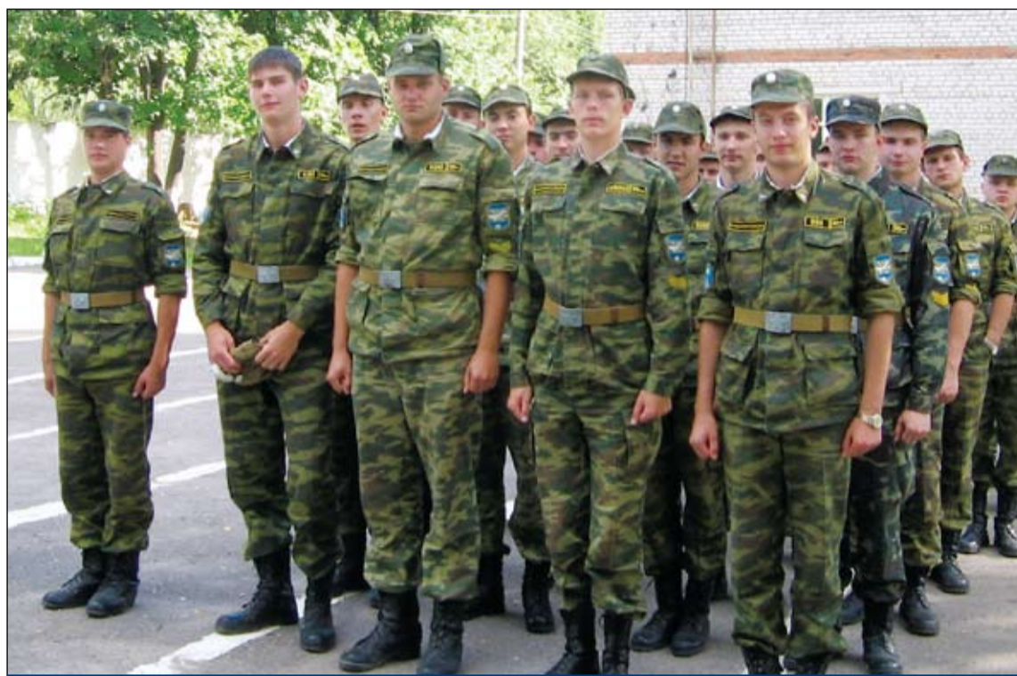
Самым сложным оказалось наука шагать в строю

В казарме нам первым делом прорекламовали уголок поли trucks. Там мы могли наблюдать биографию Владимира Владимировича Путина, его крылатые фразы, множество его фотографий с военнослужащими. Здесь же нам показали несколько листовок, рассказывающих о родах войск, почему-то не обо всех, и выдержки из Конституции РФ.