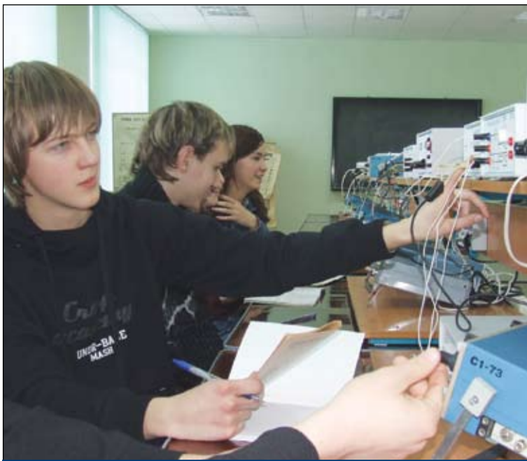
Теперь студенты СГАУ занимаются наукой на самом современном оборудовании