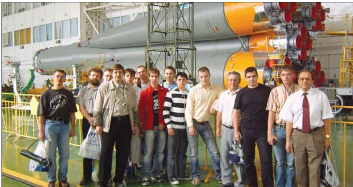
Делегация СГАУ в монтажно-испытательном комплексе Байконура