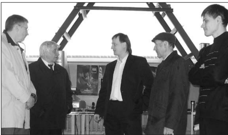
Гости семинара в центре САМ-технологий СГАУ

23-24 апреля состоялся международный семинар «Оборудование мировых производителей и внедрение современных технологий металлообработки на предприятиях региона».