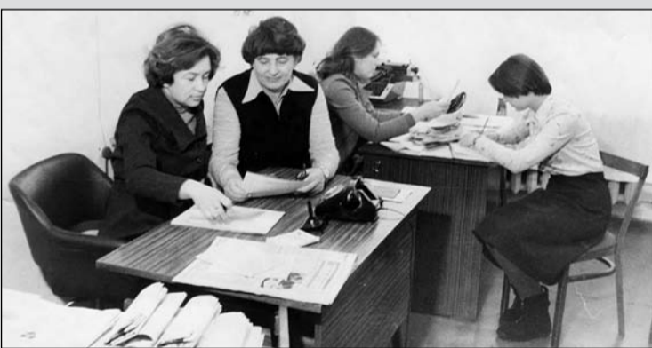
Редакция газеты «Полет», 1968 год.