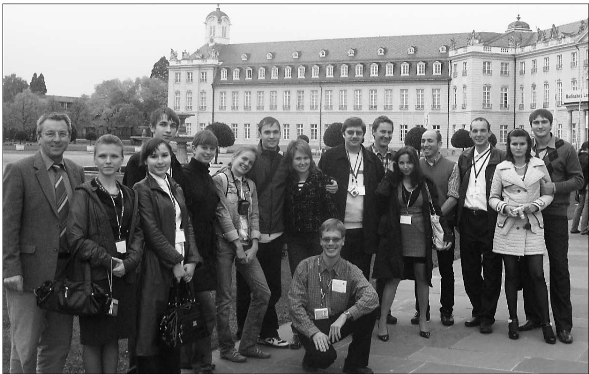
Самарская делегация в Карлсруэ