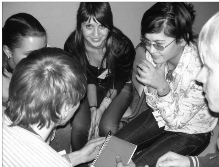
Команда СГАУ на конференции отличилась смелыми и неординарными идеями

И вновь студенты СГАУ доказали, что они – лучшие из лучших!