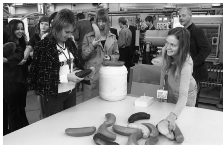
Лаборатория штамповки пластмасс в университете Дармштадта