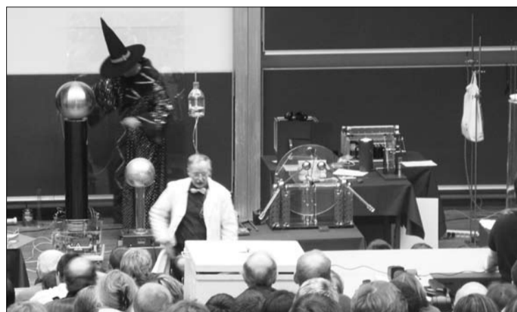
Вечеринка инженеров в университете Дуйсбурга. Шоу высокого напряжения