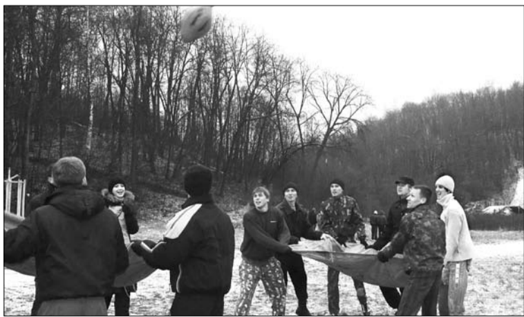
Игра в пионербол плащпалаткой