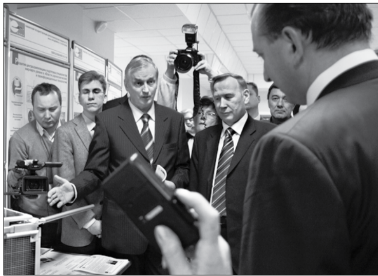
Студенческий спутник «АИСТ», наноскоп, а также научные разработки учёных университета были представлены на выставке достижений СГАУ