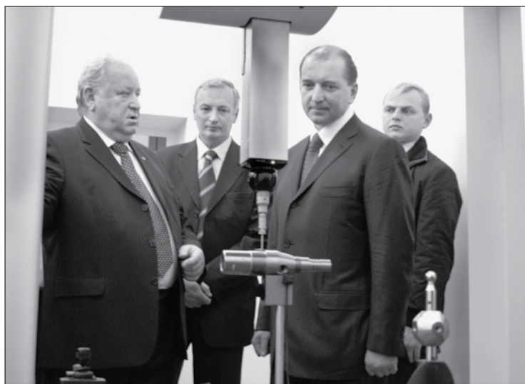
Затем глава области посетил университетский Центр инновационных производственных технологий. Губернатор ознакомился с тем, как ведётся подготовка специалистов мирового уровня для инновационного машиностроения на основе сквозного использования компьютерных 3D-моделей в проектировании и производстве специальной техники.