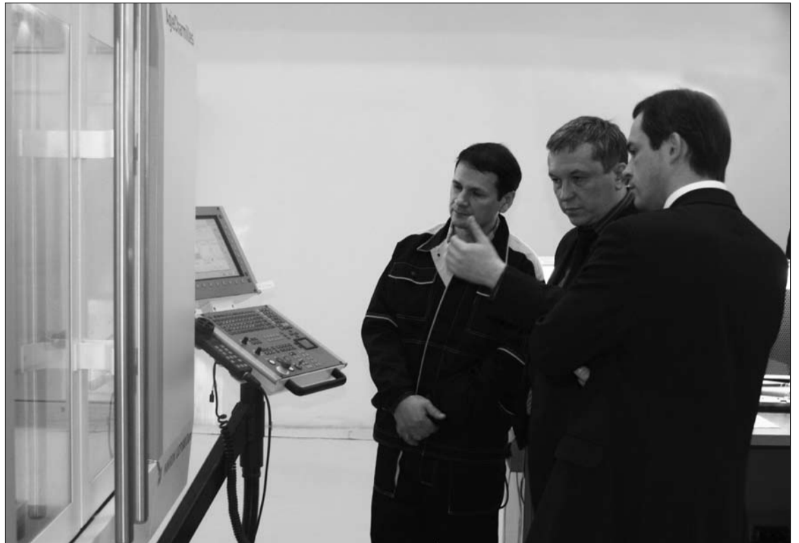
Станки с числовым управлением творят чудеса, но вот мало кто из современных рабочих способен на них работать

В пользу необходимости привлечь вузы к научно-техническому прогрессу говорит и статистика. Оборудование, пришедшее на завод, быстро выходит из строя. Потому что на предприятиях не хватает специалистов, способных качественно работать на новых станках. Институт инновационных производственных технологий СГАУ готовит инженеров, имеющих практические навыки решения всего комплекса задач подготовки производства на основе сквозного использования информации, заложенной в объёмной модели изделия – от заготовительного этапа до