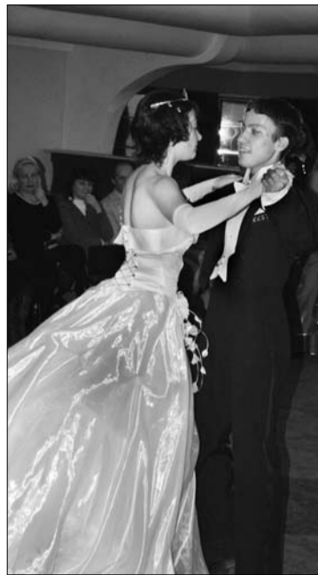
Вальс принца и принцессы завершил бал.