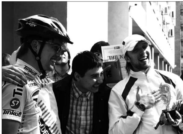
Победители трёхдневной велогонки «Храмы Самарской области».