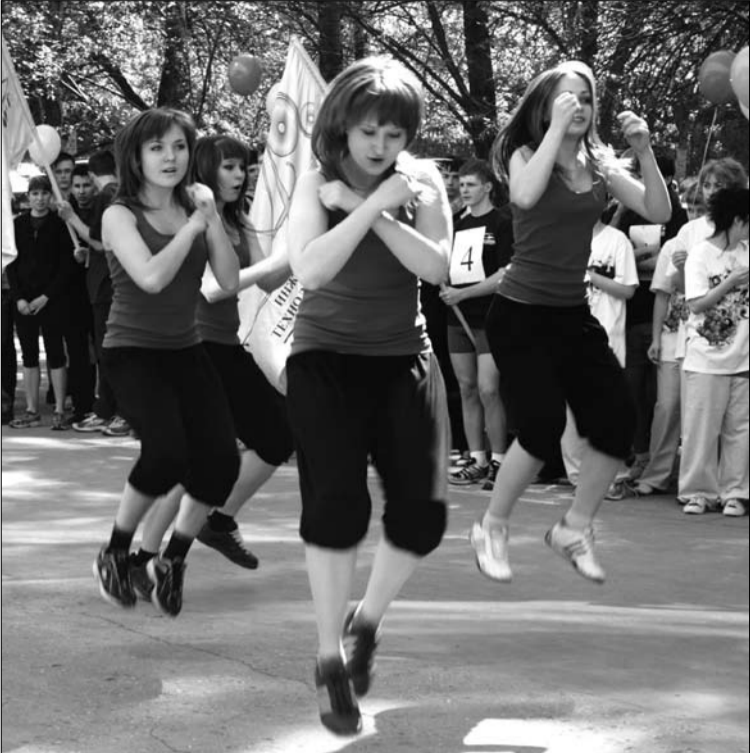
О том, что в СГАУ есть несколько команд фитнес-аэробики, мы знали. Теперь увидели.