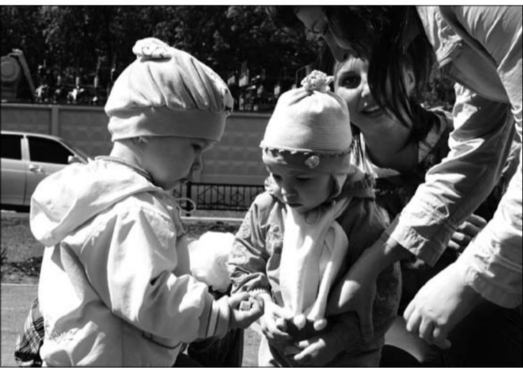
Детская площадка на улице Лукачёва – праздник для будущих студентов!