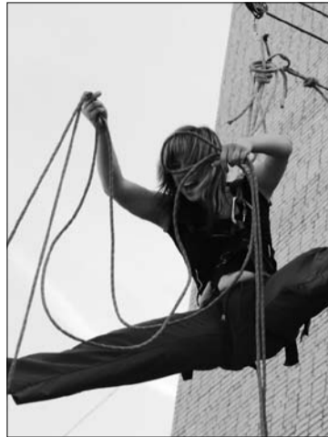
Один из самых интересных этапов военно-спортивной игры – «водовоз».