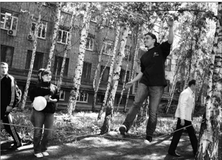
А вам слабо пройти по переправе, не держась за верхнюю верёвку?