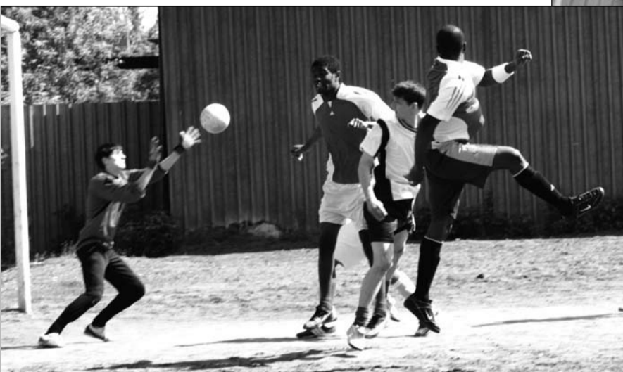
Футбольный турнир оказался самым длинным: играли 14 команд! 1-е место – сборная СГАУ «СМК», 2-е место – у команды трёхкурсников 1-го факультета, «бронза» – у объединённой команды старшекурсников 5 и 6-го факультетов.