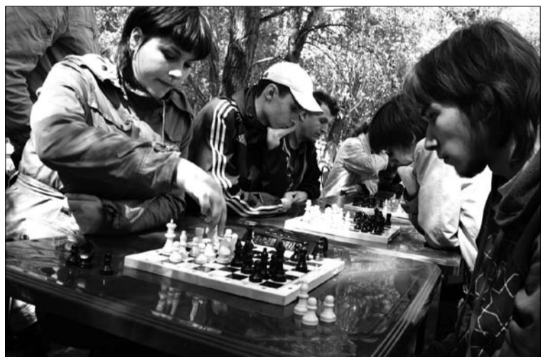
«А шахматы точно будут?» Этот вопрос интересовал многих.