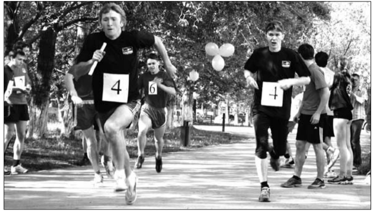
Лёгкоатлетическая эстафета снова поражала накалом страстей: переходящий кубок остался на третьем факультете, а вот выход на 3-е место команды 1-го факультета стал неожиданностью: в прошлом году «самолётчики» были последними. «Серебро» у команды 6-го факультета.