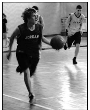
9 команд приняли участие в баскетбольном турнире. Второй год победителем становится «Банда» – сборная 1-го факультета.