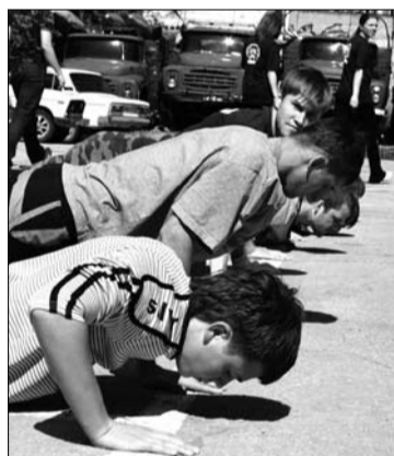
Военно-спортивная игра. На военной кафедре: команды отжимались, стреляли по мишеням, разбирали и собирали автомат на время.