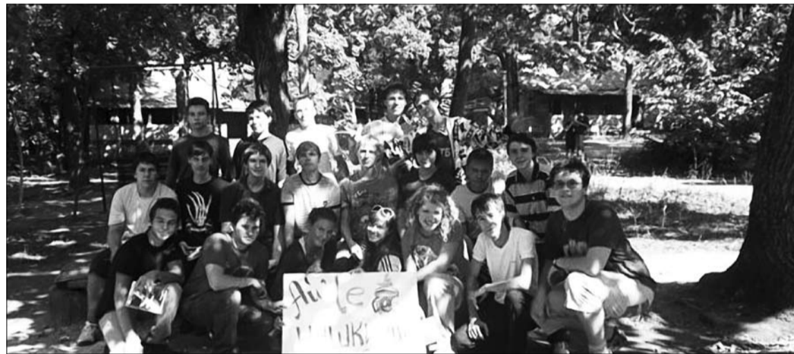
Теперь мы не просто студенты, мы команда!