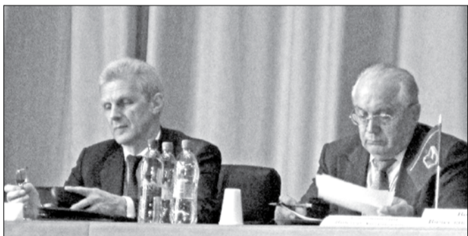
В президиуме: А. А. Фурсенко, министр образования и науки РФ, В.А. Садовничий, ректор МГУ

31 марта в Москве прошёл VI съезд профсоюза работников народного образования и науки РФ.