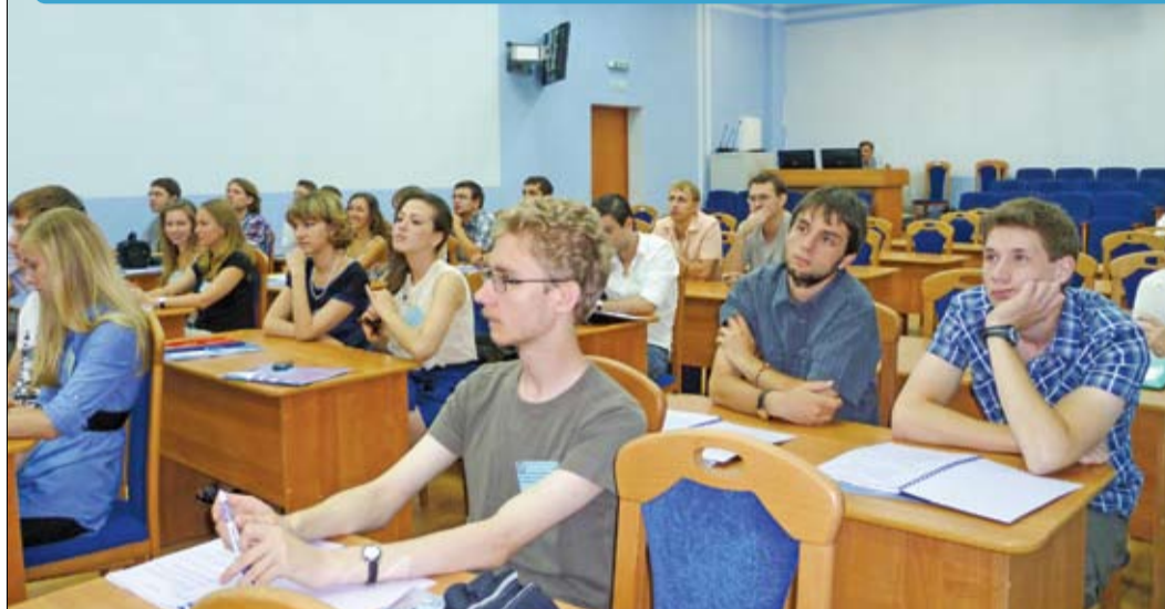
На открытии школы её участники узнали о российских программах в области космических экспериментов. (СГАУ, 15 августа)