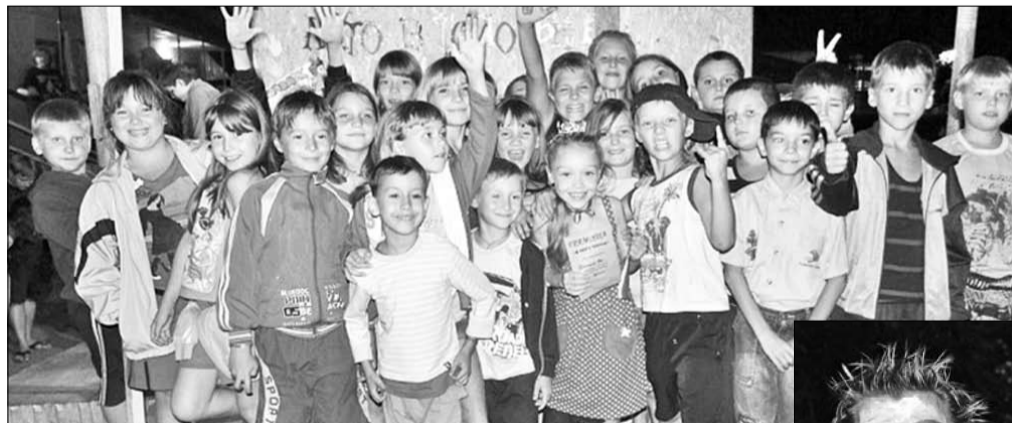
▶ Празднуем победу в конкурсе «Мисс Тополёк»