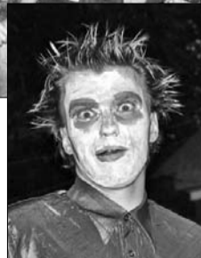
▶ Вожатый в роли сумасшедшего Шляпника

Полдень. Срывая голос, кричишь своему отряду строиться возле тебя и не разбегаться. На первый взгляд все дети одинаковые. Вся эта шумная, гомонящая толпа бегают, визжит и не сразу понимает, чего от них хочет дяденька-вожатый. Зато потом... Немного поиграть, чуть-чуть поговорить с каждым – и ты начинаешь видеть в них характер. А заодно и волнение уходит, хотя ответственность за тридцать человек – не шутка. Малышня входит в ритм не сразу, многие из них пер-