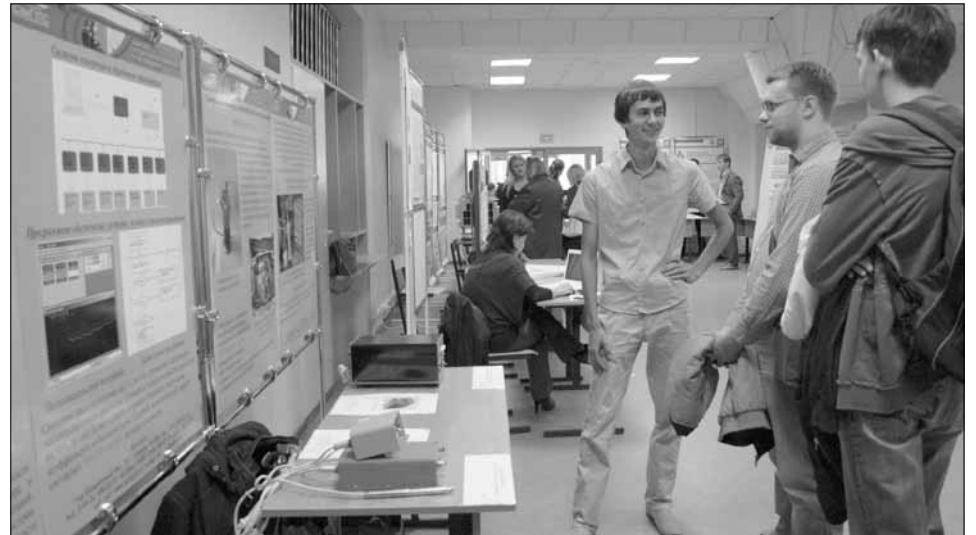
➔ Молодые учёные на выставке старались заинтересовать специалистов производства в своих разработках

— Я думаю, любой человек, однажды попав-