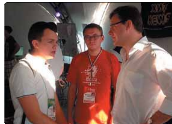
➤ Автор проекта Владимир Сухов и мэр Самары Дмитрий Азаров

Первый фильм этого цикла уже увидел свет в день города. Он называется: «Про город». Это взгляд с высоты птичьего полёта и концентрация на памятниках архитектуры и культуры. Итак: наш железнодорожный вокзал самый высокий в Европе, а наша набережная – самая длинная в России ■