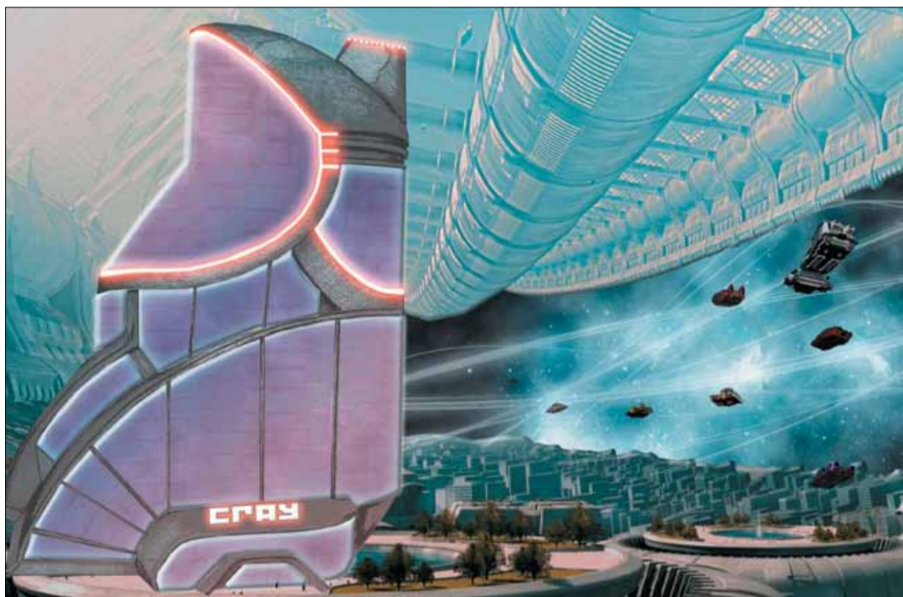
Будущее может быть разным. В том числе и таким...

Каким станет СГАУ к 2020 году, и что необходимо сделать для увеличения конкурентоспособности? На эти вопросы должна будет ответить «дорожная карта» университета.