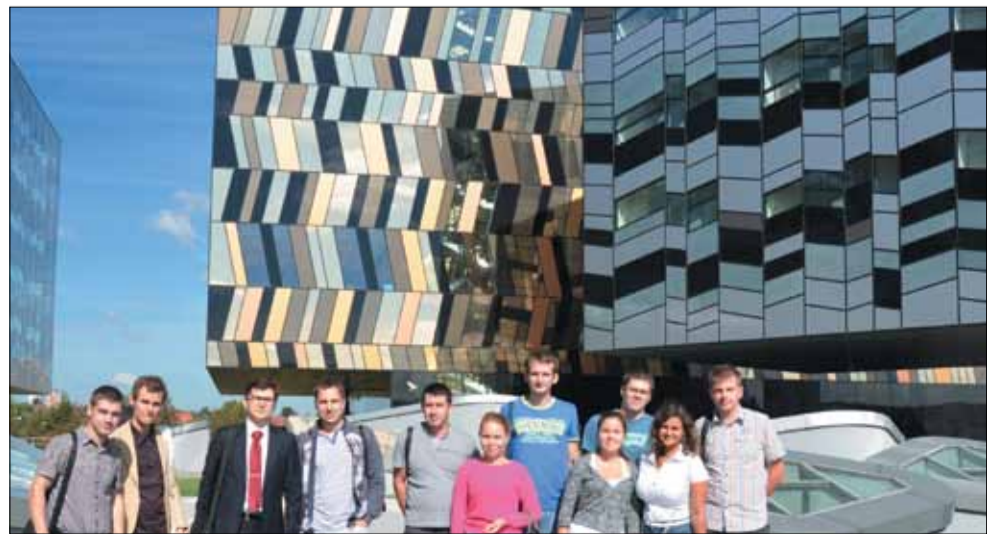
► Молодые учёные СГАУ в школе управления Сколково.

Последний день в столице запомнился продолжительной экскурсией по музею космонавтики на ВДНХ. Мы повторили историю развития мировой космонавтики, проследили за перемещением МКС в реальном времени, после чего посмотрели фильм о подготовке космонавтов. ■