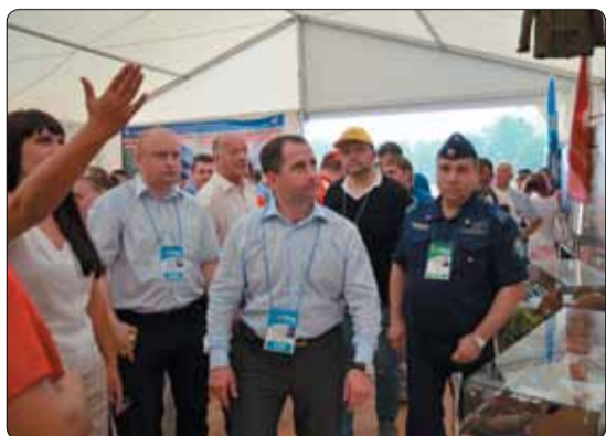
➤ М.В. Бабич осматривает экспозиции поисковых клубов Поволжья

С 18 по 28 июня на территории Самарской области на Мастрюковских озёрах проводился молодёжный форум «iВолга» под эгидой полномочного представителя Президента Российской Федерации в Приволжском федеральном округе Михаила Викторовича Бабича. Работало восемь смен: Инновации и техническое творчество, Ты предприниматель, Политика, Информационный поток, Строительство и ЖКХ, АРТ-Квадрат, Технология добра, Беги за мной, на которых молодые носители новых идей представляли свои проекты.