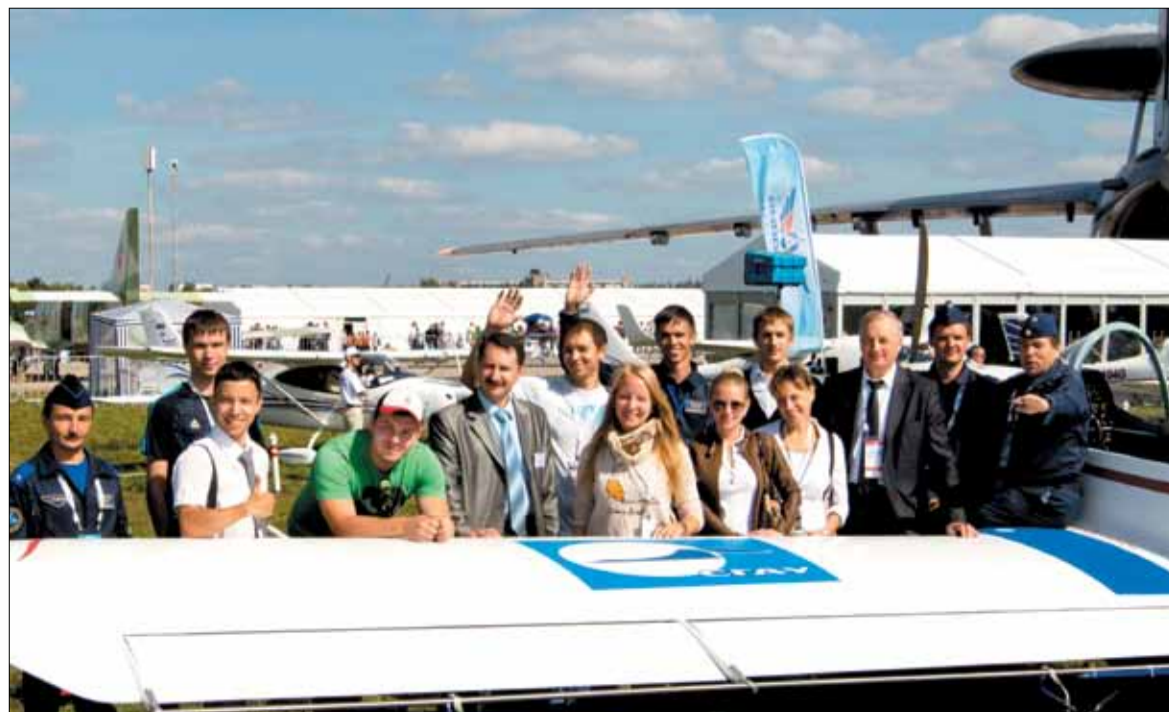
➔ А рядом с самолётом СГАУ «Ястреб» (Как, в СГАУ собирают настоящие самолёты?!) студенты встретились с ректором.