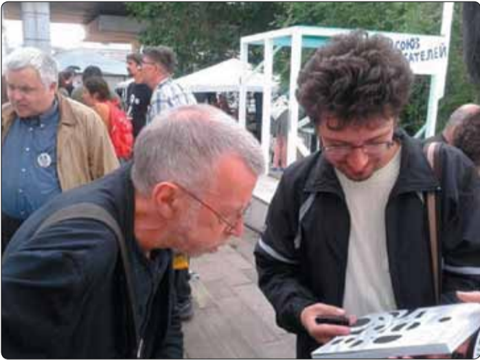
➔ Дарим экземпляр альманаха поэту – классику концептуализма – Льву Рубинштейну.