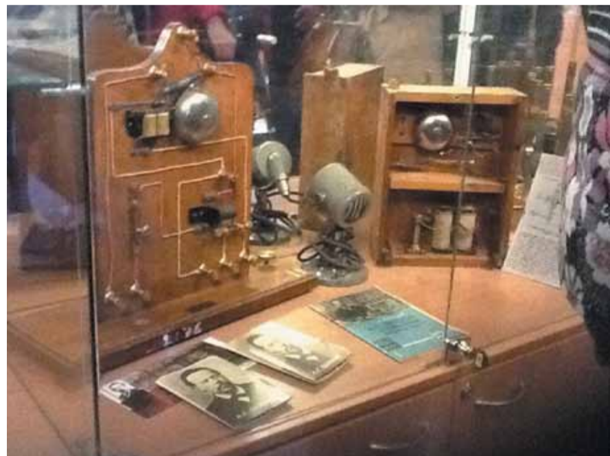
► Прибор для регистрации грозозарядов, собранный лично Поповым. Музей истории физики ТГУ.

Олимпиада проходила в два этапа. Теоретический и компьютерный туры. Мы