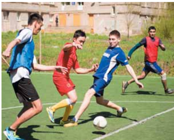
Фото Дэвида Ньюмана, гр. 31015335

Победителем турнира стала команда Казахстана, на втором месте – команда из Нигерии, на третьем месте – Колумбия – Коста-Рико. В каждой из этих команд играли студенты СГАУ. ■