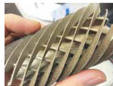
▶ Первая деталь, выращенная на новом оборудовании. Создать такую конструкцию традиционными методами невозможно

Оборудование для объёмной печати металлических изделий будет активно использоваться лабораторией и в других направлениях научных исследований. Например, в медицине. Изготовленные на нём имплантаты, в мельчайших деталях повторяющие анатомические особенности конкретного человека, могут использоваться в стоматологии и в хирургии. В том числе для лечения сложных переломов позвоночника и суставов. ■