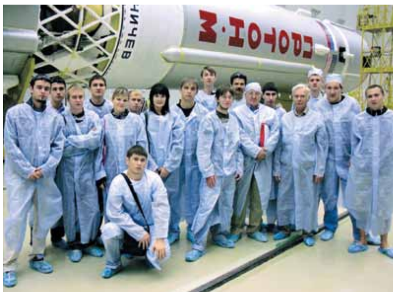
▶ Во время практики на космодроме студенты посещают монтажно-испытательные комплексы ракет-носителей