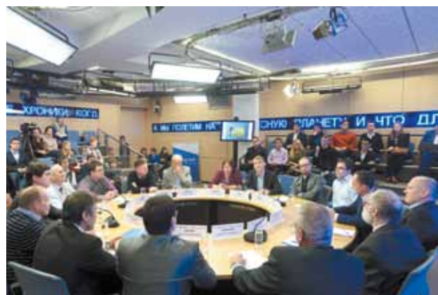
➤ 11 декабря 2015 г., Москва, РИА «Новости», ток-шоу «Марсианские хроники» с участием делегации СГАУ