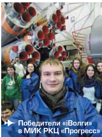
▶ Победители «iВолги» в МИК РКЦ «Прогресс»