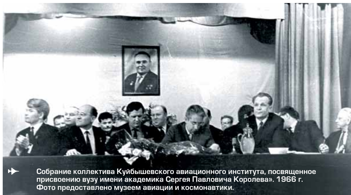
➤ Собрание коллектива Куйбышевского авиационного института, посвященное присвоению вузу имени академика Сергея Павловича Королёва. 1966 г.

А ведь в такой же ситуации был Юрий Гагарин накануне своего исторического полёта: риск огромный, никто не знал, что ждёт человека в космосе, но он рвался в этот полёт, и он его совершил, этот полёт в неизвестное. И этот полёт в неизвестное, за пределы обычного оказал огромное влияние на самых разных людей в разных странах и будет всегда привлекательным для новых поколений людей. ■