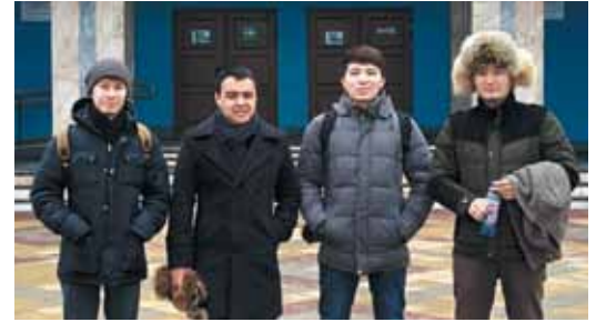
Магистры КазНУ имени аль-Фараби

Управление международной деятельности совместно с двумя кафедрами вуза разработало образовательную программу повышения квалификации «Контроль и испытания устройств микроэлектроники космического назначения. Основы наноспутниковых технологий». Эта программа вызвала интерес у Казахского национального университета имени аль-Фараби. Две недели четверо молодых учёных КазНУ учились в Самаре.