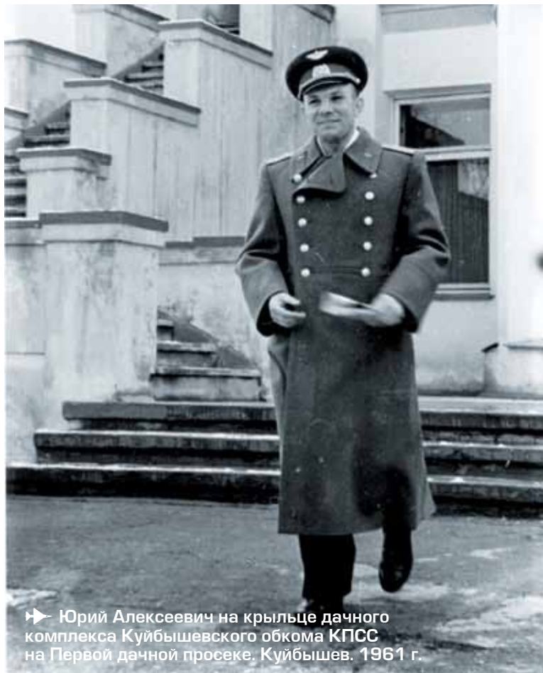
Юрий Алексеевич на крыльце дачного комплекса Куйбышевского обкома КПСС на Первой дачной просеке. Куйбышев. 1961 г.

Гагарина и других гостей разместили в небольшом доме на берегу Волги в гостиничном комплексе Куйбышевского обкома КПСС на Первой дачной просеке. Территория тщательно охра-