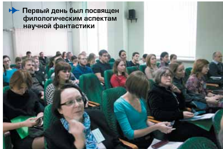
Первый день был посвящён филологическим аспектам научной фантастики

Первые Лемовские чтения прошли в СГАУ в 2007 году (под названием «Фантастика и технологии»), сборник научных статей был издан в 2009 году. Обсуждались вопросы, связанные с понятием и проблемой фантастического, жанрами, темами и направлениями фантастики, универсальностью фантастического, интерпретацией и анализом творчества Станислава Лема в физике, космологии и литературоведении.