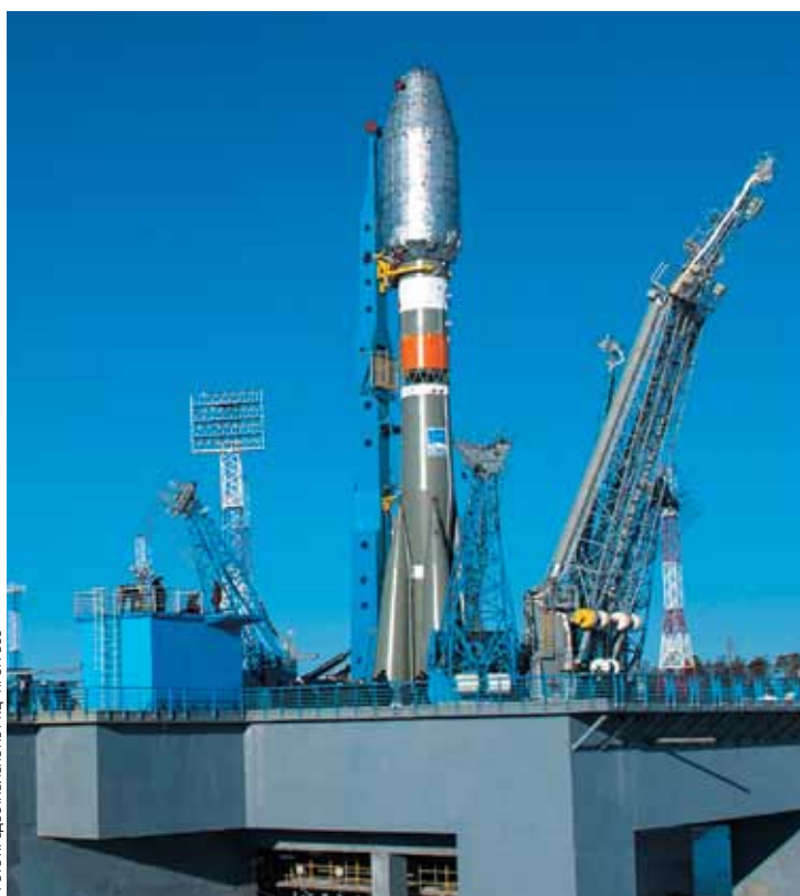
➔ «Сухой» вывоз ракеты-носителя Союз-2.1а. Космодром «Восточный». 21 марта 2016 г.

Напомним, испытания стартового комплекса на космодроме «Восточный» начались ещё 21 марта 2016 года. Ракета-носитель «Союз-2.1а» была вывезена с технического на стартовый комплекс и установлена в стартовую систему. В первый день были проведены наезд мобильной башни обслуживания (МБО), сборка схем испытаний систем стартового комплекса и ракеты-носителя, электрические испытания систем ракеты-носителя и блока выведения «Волга». Все системы сработали штатно. Генеральный директор госкорпорации Роскосмос Игорь Комаров отметил: «Сегодня – очень важный для нас момент. Начались комплексные испытания стартового комплекса, «сухой вывоз» ракеты космического назначения «Союз-2». Первый день прошёл штатно. Сотрудники всех предприятий сработали отлично. Поздравляю!»