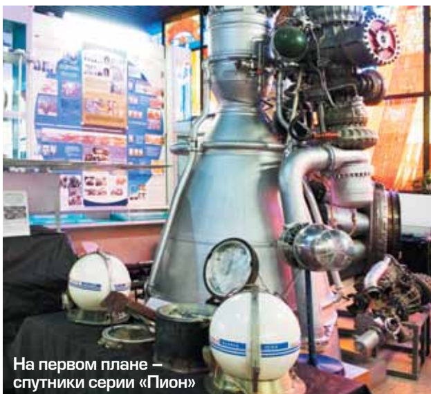
На первом плане – спутники серии «Пион»