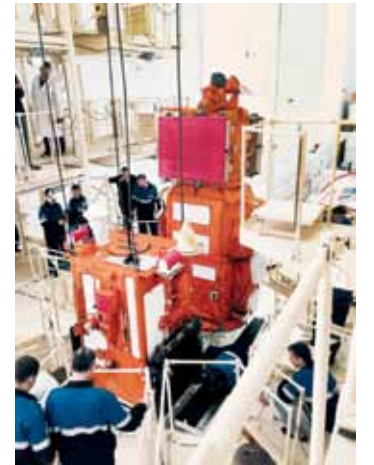
Установка спутников на блок выведения «Волга»

На космодроме «Восточный» сотрудники предприятий РОСКОСМОСА ФГУП «ЦЭНКИ», РКЦ «Прогресс», ВНИЭМ, а также специалисты МГУ и СГАУ начали сборку космической головной части ракеты-носителя «Союз-2.1а».