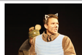
ФЕСТИВАЛЬ «Студенческая осень»-2018

Расписание 2/11 — СТЭМ «Пятая любовь» 7/11 — СТЭМ «PerFCT» 9/11 — СТЭМ «Non drama» 12/11 — СТЭМ «Бар' DUCK им. С.А. Никитина» 14/11 — СТЭМ «АппендиксЪ» 16/11 — СТЭМ «Кислород» 19/11 — СТЭМ «Квартал» 21/11 — гала-концерт фестиваля СТЭМов «Студенческая осень 2018».