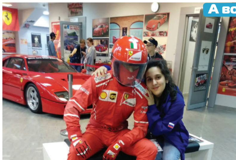
А волонтеры были!

«Основной отбор прошёл в формате интервью с рекрутером. Плюс мы отправляли табличку по нашему