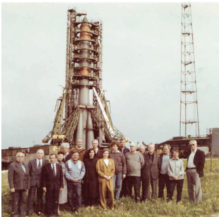
Рабочая группа на запуске