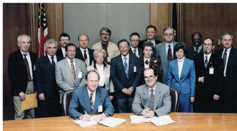
NASA. Подписание договора