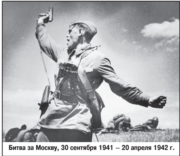
Битва за Москву, 30 сентября 1941 – 20 апреля 1942 г.

Мы нередко слышим разнообразные высказывания о патриотизме. В студенческих кругах стало модным участвовать в митингах, критиковать нынешнюю власть и говорить о том, как несправедлива жизнь. Иногда я даже слышал высказывания о том, что патриотом быть плохо. Давайте попробуем разобраться, что же такое патриотизм и нужно ли быть патриотом.