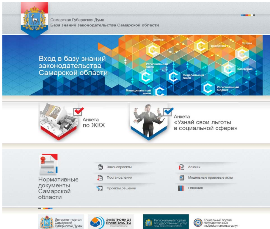
Рис. 2. База знаний законодательства Самарской области

ний этой области. Подчас термины так связаны друг с другом (например, определяются друг через друга), что без предварительной подготовки – базовых знаний, невозможно понять о чем идет речь. Получение таких знаний может быть длительным по времени, дорогим по стоимости или сложным для восприятия.