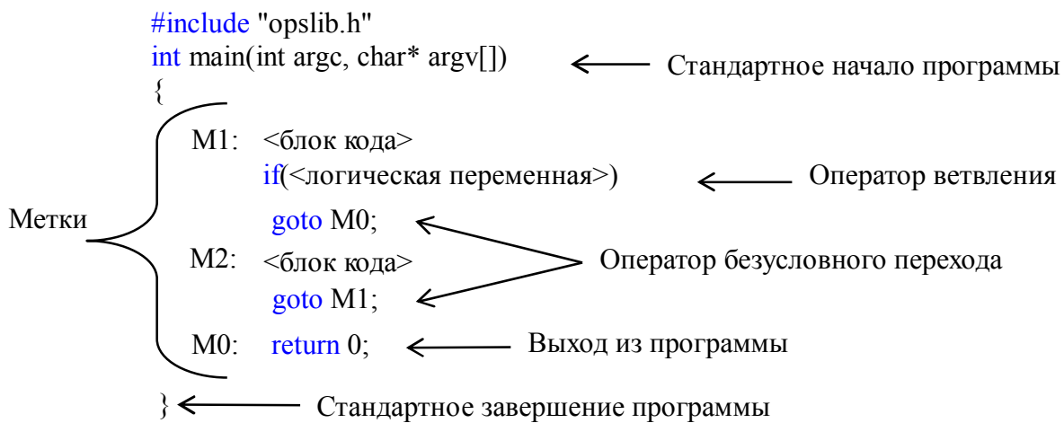
Рис. 4. Пример структуры программы

Если настраиваемый язык не содержит оператора безусловного перехода, то его можно заменить комбинацией переменной, заменяющей метки, цикла и переключателя.