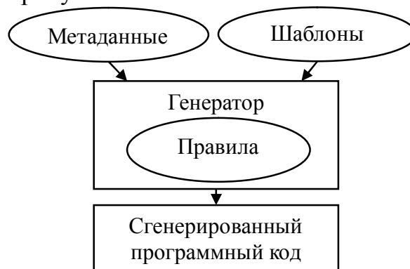
Рис. 1. Генерация программного кода

Основой любого генератора являются три ключевых компонента: метаданные (структура, которую мы пытаемся смоделировать в программе), шаблоны (образцы по которым будет создан код) и внутренние правила, которые определяют структуру и поведение метаданных, шаблонов и их взаимодействие. На выходе генератора получаем искомый программный код. Схема генерации представлена на рисунке 1.