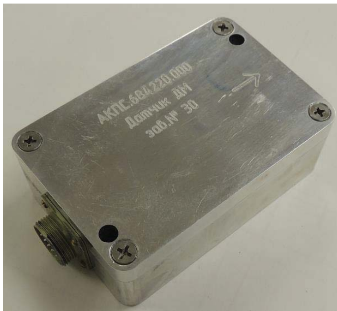
Рисунок 1 – Внешний вид магнитного датчика

Состав магнитного датчика. Внешний вид магнитного датчика (ДМ) изображён на рисунке 1. Корпус ДМ выполнен из сплава АМгб, в качестве соединителя используется РС19ТВ.