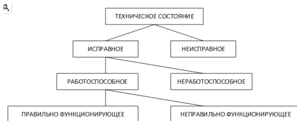
Рис. 2. Виды технических состояний

Ответ: техническое состояние – совокупность признаков (параметров), характеризующих изменение свойств объекта в процессе эксплуатации. Различают следующие виды технических состояний: исправное, неисправное, работоспособное, неработоспособное (рис. 2).