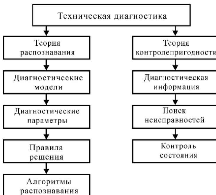
Рис. 1. Структура технической диагностики

Ответ: техническая диагностика изучает методы получения и оценки диагностической информации, диагностические модели и алгоритмы принятия решений. Техническая диагностика базируется на двух теориях: теории распознавания и теории контролепригодности (рис.1).