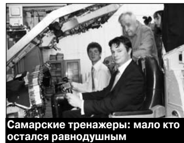
Самарские тренажеры: мало кто остался равнодушным