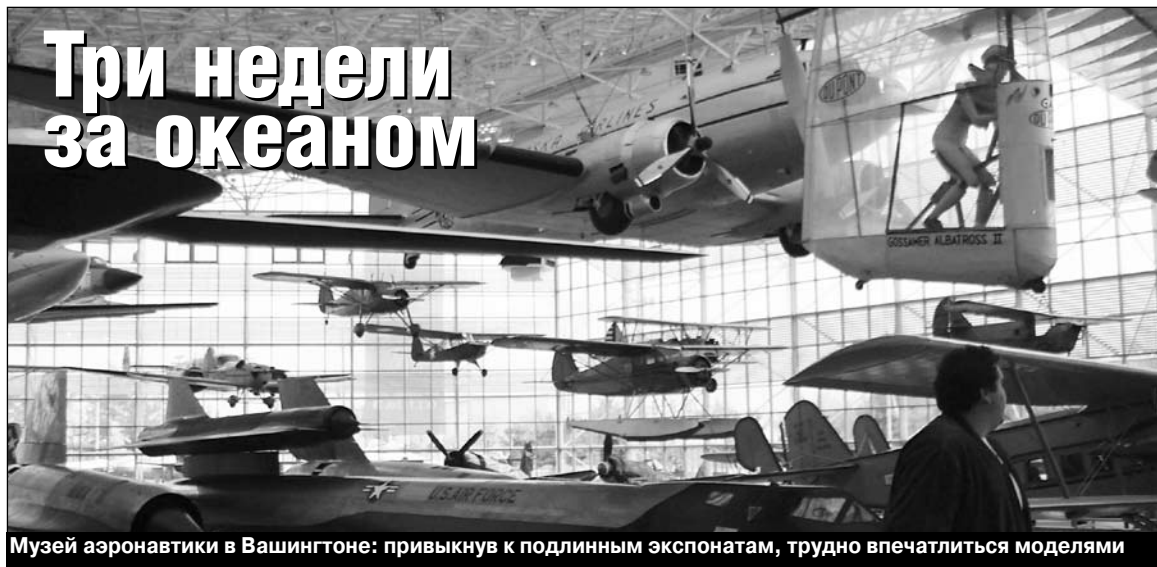
Музей авиации в Вашингтоне: привыкнув к подлинным экспонатам, трудно впечатлиться моделями

со стр. 1 → За пять дней в Вашингтоне мы посетили госдепартамент, министерство образования, ассоциацию колледжей, бизнес-форум. Разумеется, музей авиации, аборигенов, государственная галерея вошли в нашу самостоятельную культурную программу. Музей авиации, как и все столичные музеи, впечатляет только размерами помещения. Экспозиция же может впечатлить только человека, который никогда не был в нашем музее авиации и космонавтики, центре истории авиационных двигателей, а также в музеях наших базовых предприятий. Обычного обывателя (американского и русского) можно порадовать бутафорией, выпускника СГАУ - вряд ли... Зато интересно было в Капитолии. Туда, в отличие от российской Думы, попасть довольно просто по бесплатному билету. До 11 сентября 2001 года вход был совершенно свободным. Свобода посещения законодательного собрания США не затрагивает только одну персону - президента. Он туда может прийти только по приглашению, и один раз в год - отчитаться перед своими избирателями.