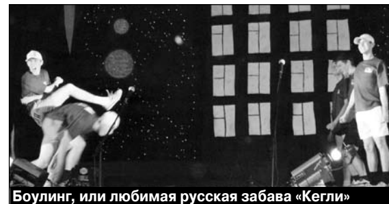
Булинг, или любимая русская забава «Кегли»

Факультет первый. Свет погас. Занавес открылся. Первая эмоция: «Спасибо, что подписали на декорациях «ЗАДНИК», много вопросов ушло сразу же!».