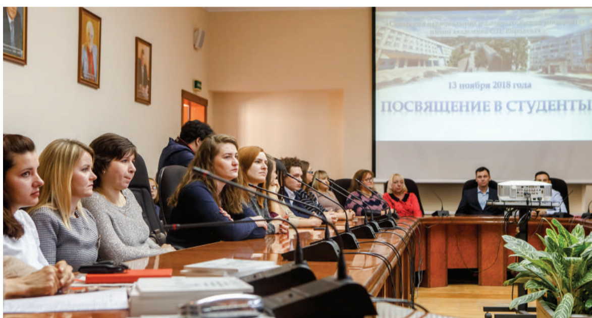
Во время церемонии посвящения студентов напутствовали представители областной власти и руководство вуза

Уникальность будущих специалистов заключается в том, что их профессиональные навыки дополняются глубоким пониманием психологии людей с нарушениями здоровья, чётким знанием повседневных проблем и вызовов, с которыми сталкиваются