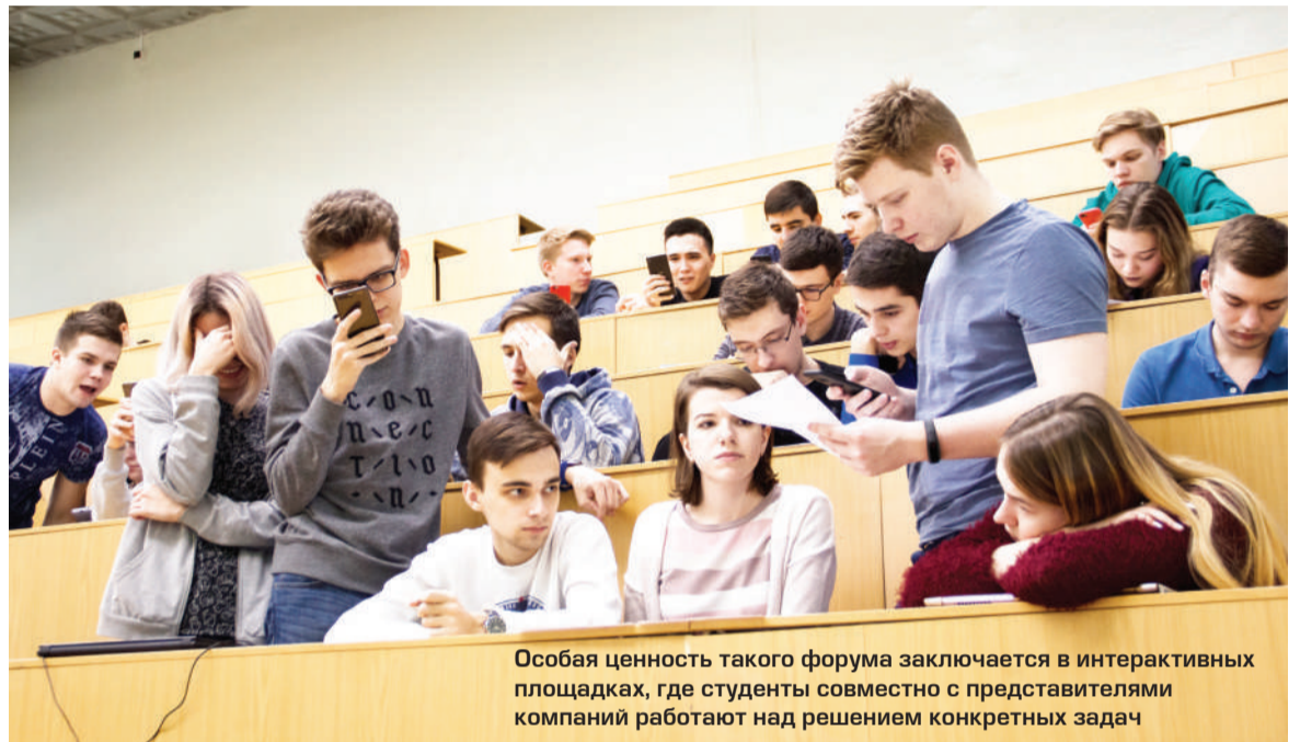
Особая ценность такого форума заключается в интерактивных площадках, где студенты совместно с представителями компаний работают над решением конкретных задач

Проектная деятельность междисциплинарных студенческих команд совместно с работодателями и менторами от института экономики и управления Самарского университета закончилась презентацией пяти социально-значимых проектов в разрезе концепции «устойчивого развития бизнеса» для компаний: ПАО «АВТОВАЗ», ПАО «Кузнецов», «Российский федеральный ядерный центр-ВНИИЭФ», АО «Ижевский радиозавод» и ООО «Роберт Бош Самара». Перед началом проектной деятельности специалисты Пивоваренной компании «Балтика» провели лекторий на тему «Устойчивое развитие бизнеса». Победителем проектной деятельности стала команда студентов, выполнившая проект для ПАО «Кузнецов». Ребята решали проблему по снижению уровня шума самолёта, за что получили приглашение на испытание нового двигателя от ПАО «Кузнецов». Победители и участники получили не только опыт проектной деятельности совместно с крупнейшими работодателями, но и подарки от компаний и организаторов форума.