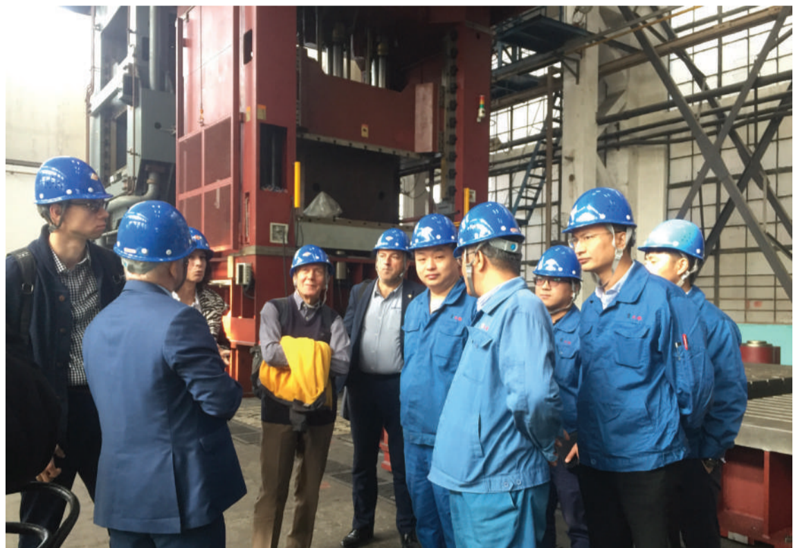
На заводе прессового оборудования Тяньцзинь

«Такие материалы применяются в авиационной промышленности в формате сэндвич-панелей: листы алюминия склеиваются с полимером, получается новый материал, который объединяет свойства металла и полимера. Их использовать в авиационной лег-