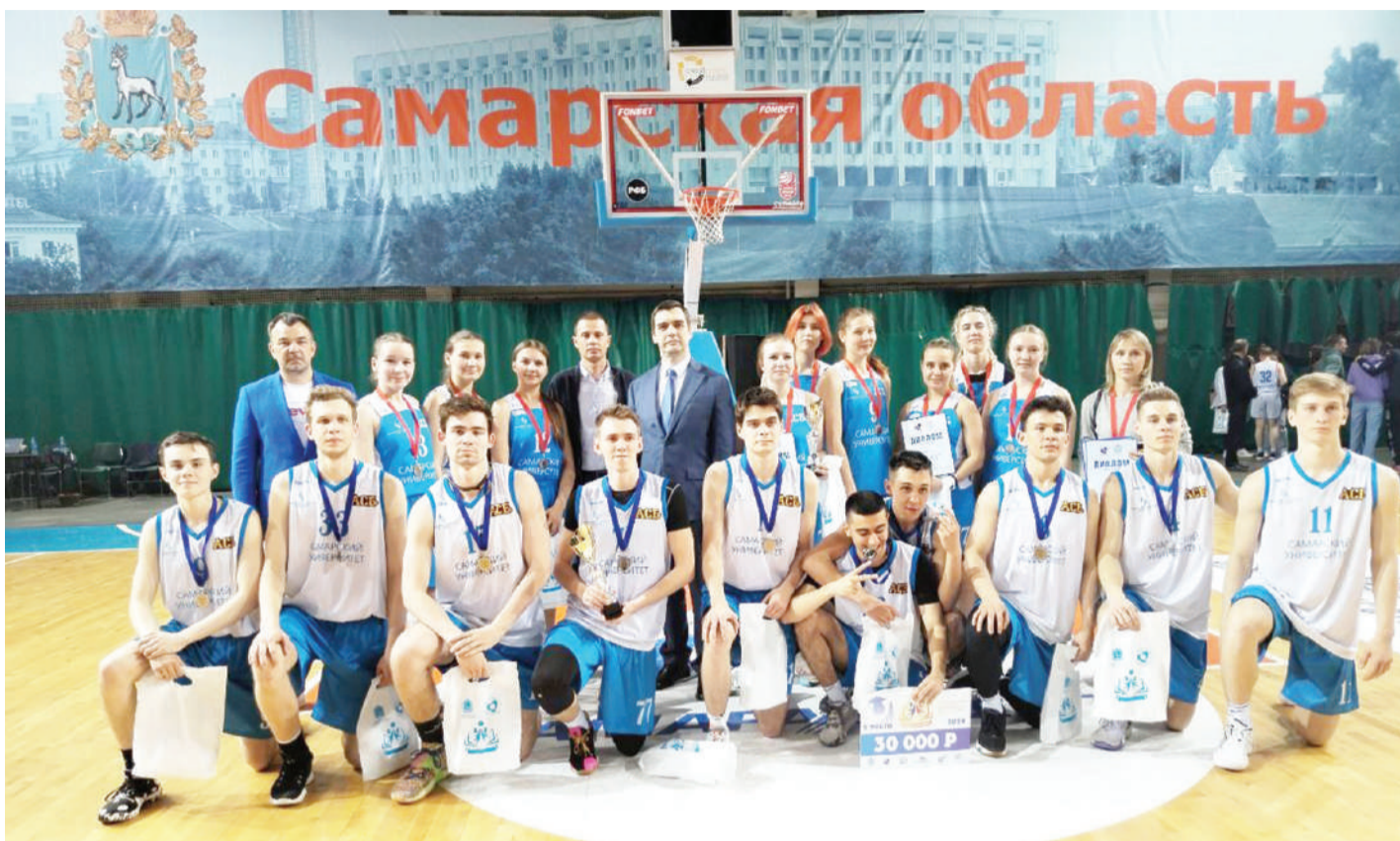
Женская и мужская сборные команды Самарского университета им. Королёва стали серебряными призёрами Кубка Азарова