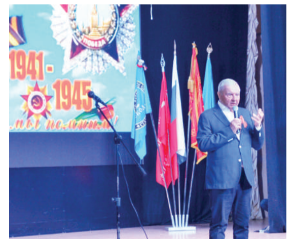
Выступает президент университета, академик РАН Виктор Сойфер