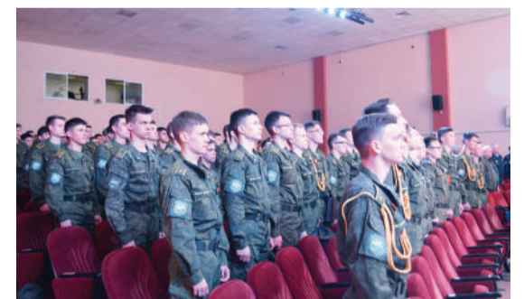
Курсанты военного учебного центра и другие зрители исполнили Гимн России