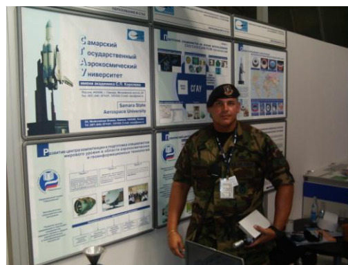
С достижениями СГАУ знакомится летчик ВВС США майор Пэйн

Стенд СГАУ посетили большое количество участников выставки, интерес проявляли выпускники университета, работающие в различных сферах аэрокосмической отрасли, а также зарубежные и российские гости и участники.