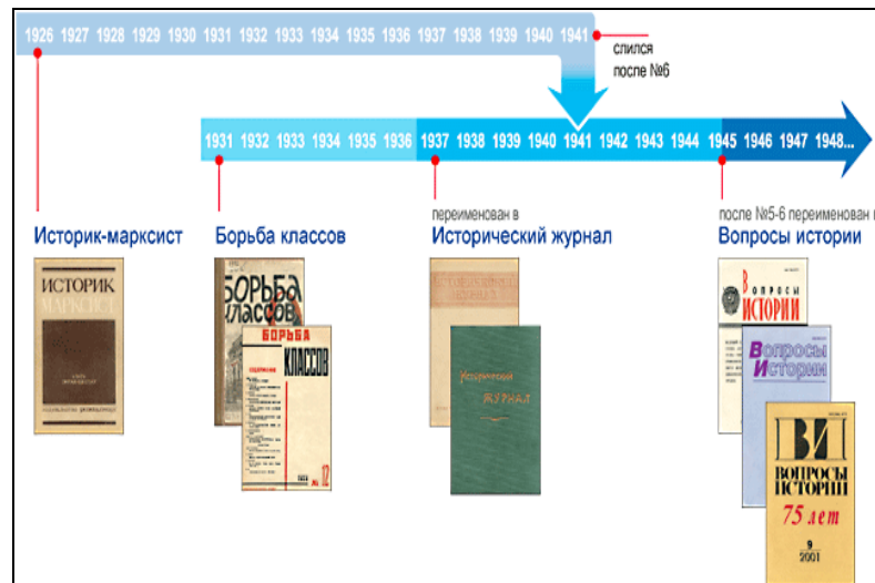
Рисунок 1 – Преемственность исторических журналов 319

В связи с этим вероятно представляется утверждение, что «Историк-марксист», «Борьба классов», «Исторический журнал» и «Вопросы истории» обладали внутренней логической связанностью и преемственностью (Рисунок 1).