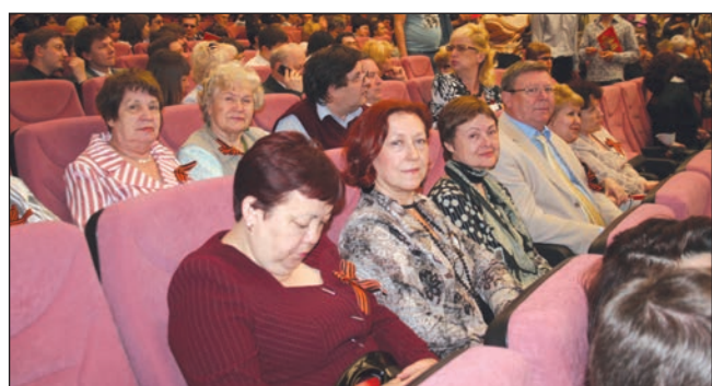
Перед началом пленарного заседания конференции в здании администрации Самарской области