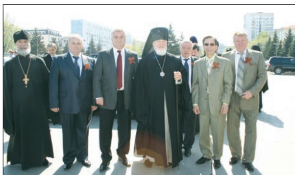
На площади Славы в Самаре - одни из организаторов конференции

4-5 мая по инициативе и под руководством правительства Самарской области, Самарской губернской думы, Совета ректоров высших учебных заведений Самарской области и Самарского регионального отделения партии «Единая Россия» состоялась Всероссийская научная конференция «Великая Победа в памяти народа», посвященная 65-летию победы Советского Союза и всего советского народа в Великой Отечественной войне. Эта научная конференция венчала серию конференций, посвященных юбилею Победы, которые прошли в городе и области.