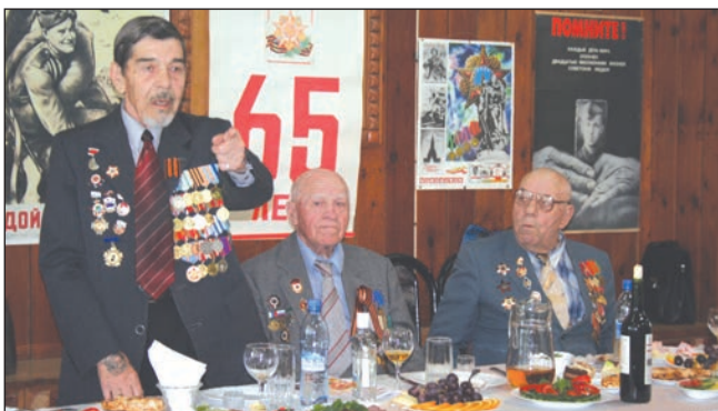
Ветераны войны СамГУ накануне Дня Победы

В конференции приняли участие ученые-историки, философы, экономисты, политологи, социологи, юристы, филологи, культурологи, исследователи и педагоги, работники библиотек и музеев, представители церкви из Москвы, Самары, Волгограда, Воронежа, Пензы, Чебоксар, Саранска, Сызрани, Тольятти, Кинеля, Октябрьска. Первый день был посвящен работе 9 секций, отражавших главные направления изучения истории Великой Отечественной войны: теоретическое и философское осмысление истории и уроков войны, проблемы соотношения личности, власти и об-